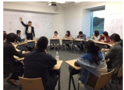
企業担当者や大学の先生を交えて 自由にディスカッション