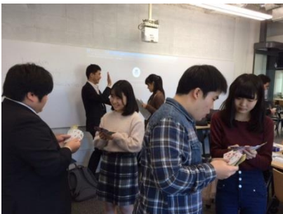
カードを使ったゲームで 国際ビジネスを体験