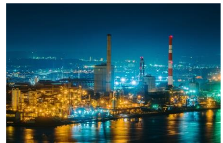
千葉ポートタワーからの眺め