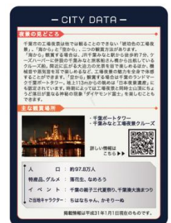
全国工場夜景カード（裏）