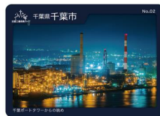
全国工場夜景カード（表）