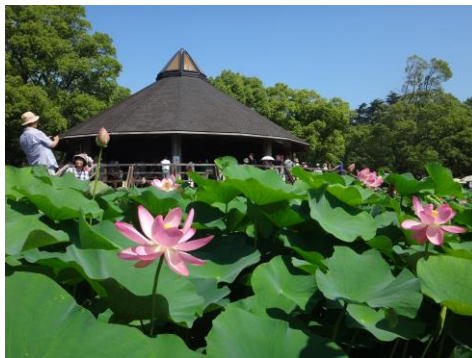
大賀ハス(昨年の様子)