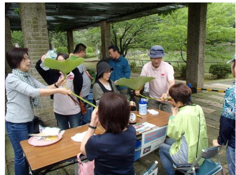
象鼻杯の体験(昨年の様子)