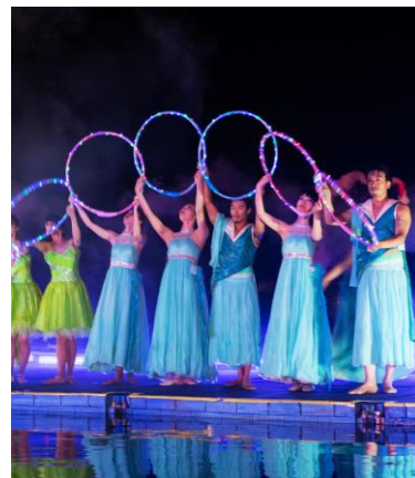
水上ステージパフォーマンス (昨年の様子)