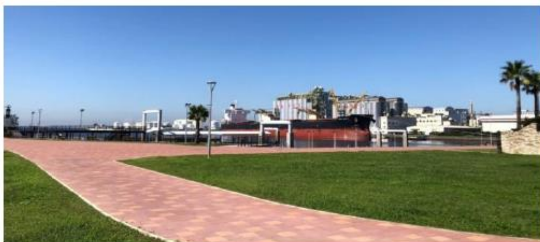
千葉みなと棧橋公園