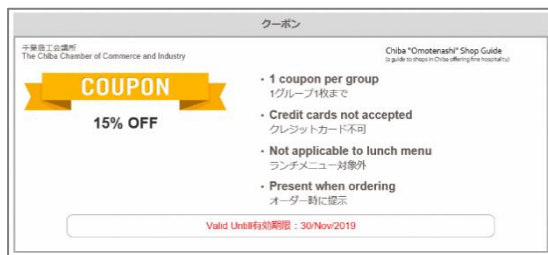
クーポンプレビュー