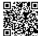
千葉おもてなしSHOPガイド (QRコード)

【サイトアドレス】 https://omotenashi-chiba.net/ （サイト公開は9月17日からです。ご注意ください。）