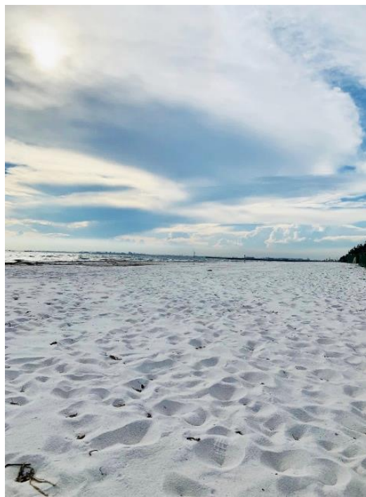
リニューアル後の現地写真