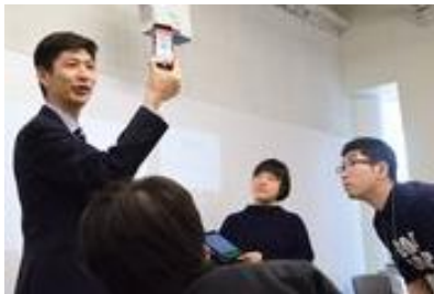
最先端の技術やビジネスを企業から講義