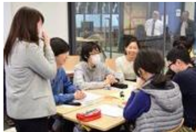
企業の若手社員と交流