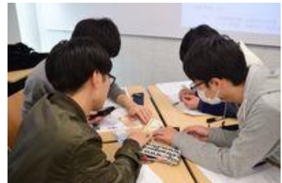
講義だけでなく、グループワークで学びを深める