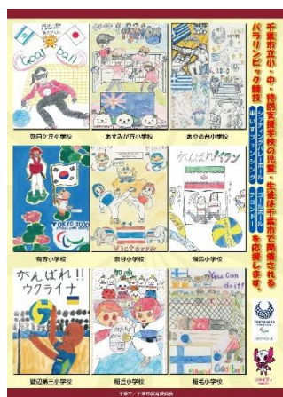
1枚に9作品のB1ポスター案