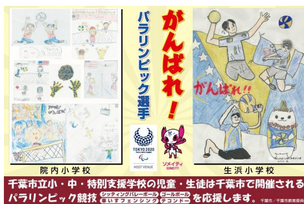
1枚に2作品のB3ポスター案