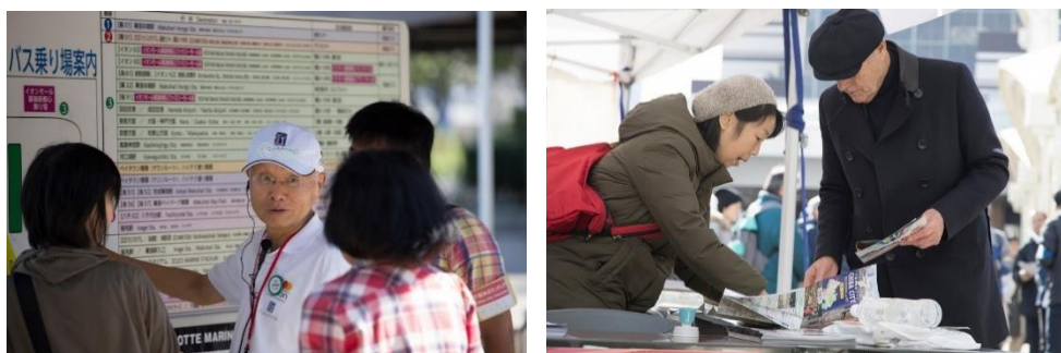
都市ボランティア実地研修の様相