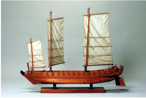
①五大力船模型（木更津市郷土博物館金のすず蔵）