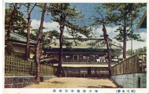
④海気館絵葉書（当館蔵）