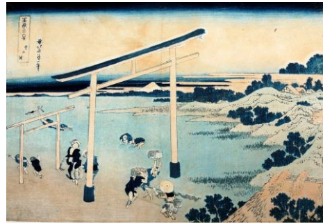
②葛飾北斎「富嶽三十六景 登戸浦（当館蔵）」