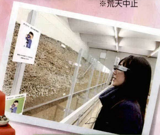
スマートグラス体験