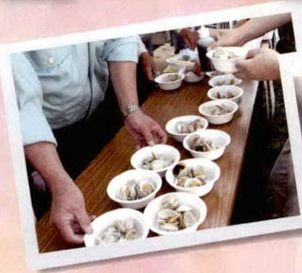
縄文グルメの振る舞い