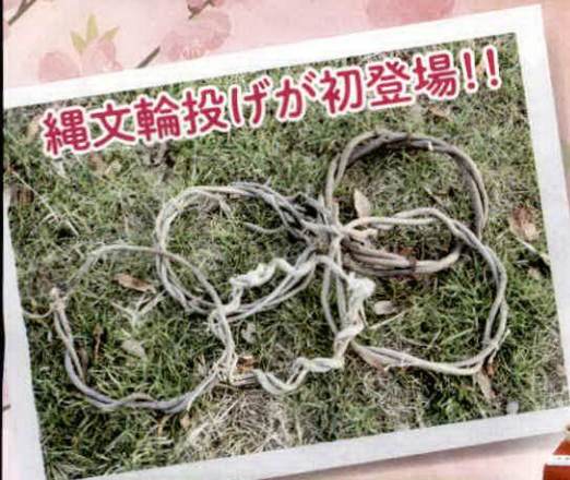
縄文輪投げが初登場!!