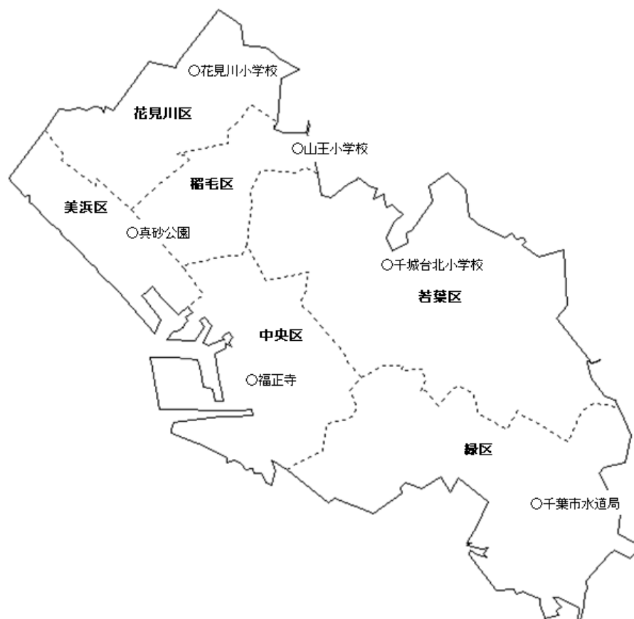
図 一般環境中ダイオキシン類調査地点