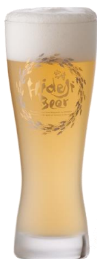
九州クラフト日向夏

これまでの黒ビールとは一線を画す異次元の濃色ビールです。質の良い苦みと豊かな味わいが食事を引き立てます。