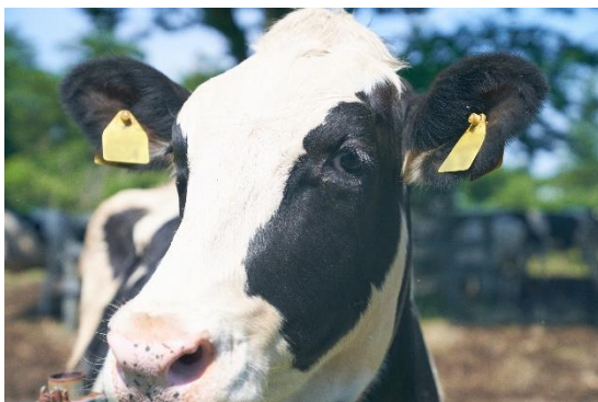
牛とのふれあい体験