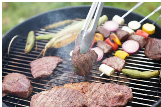
地元野菜でのバーベキュー