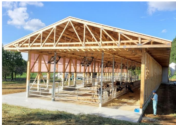
アニマルウェルフェアに配慮した牛舎