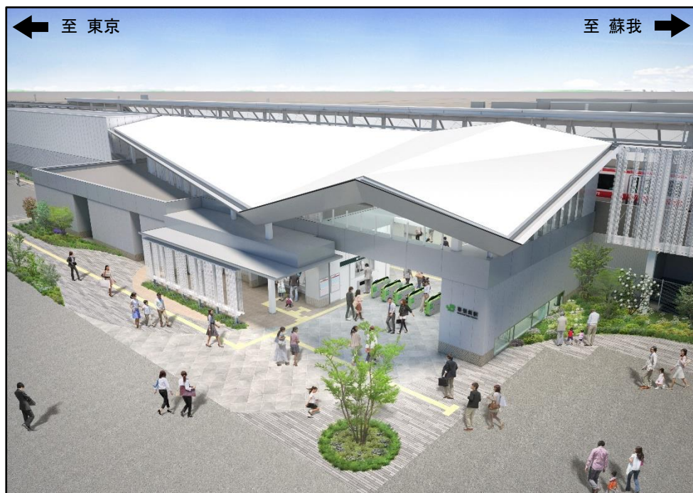
【駅舎外観イメージ図(南側より)】