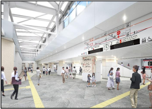
【改札内コンコースイメージ図】