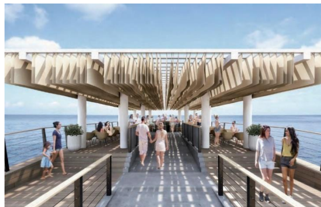
整備後のイメージ ※デッキ上部(カフェ)は民間事業者が整備