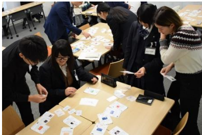
カードゲームでSDGsについて学習