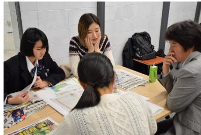
大学生や社会人と交流