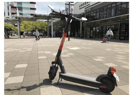
電動キックボード