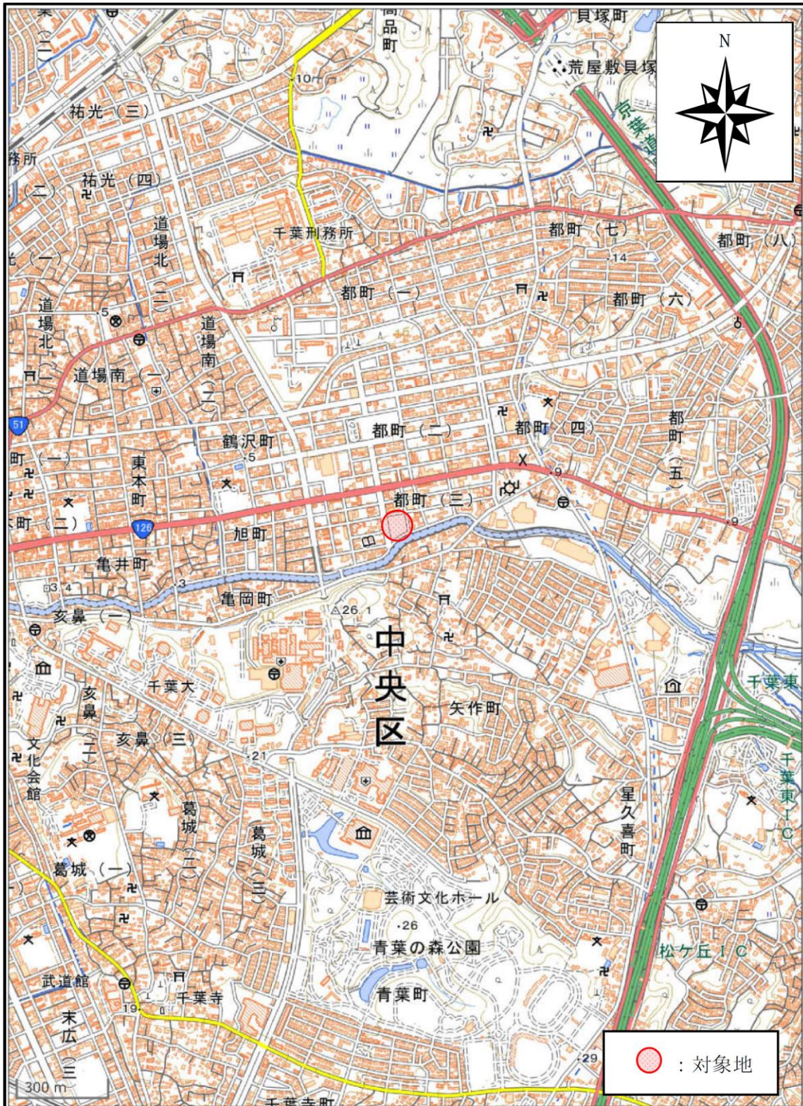
申請に関わる土地の周辺の地図