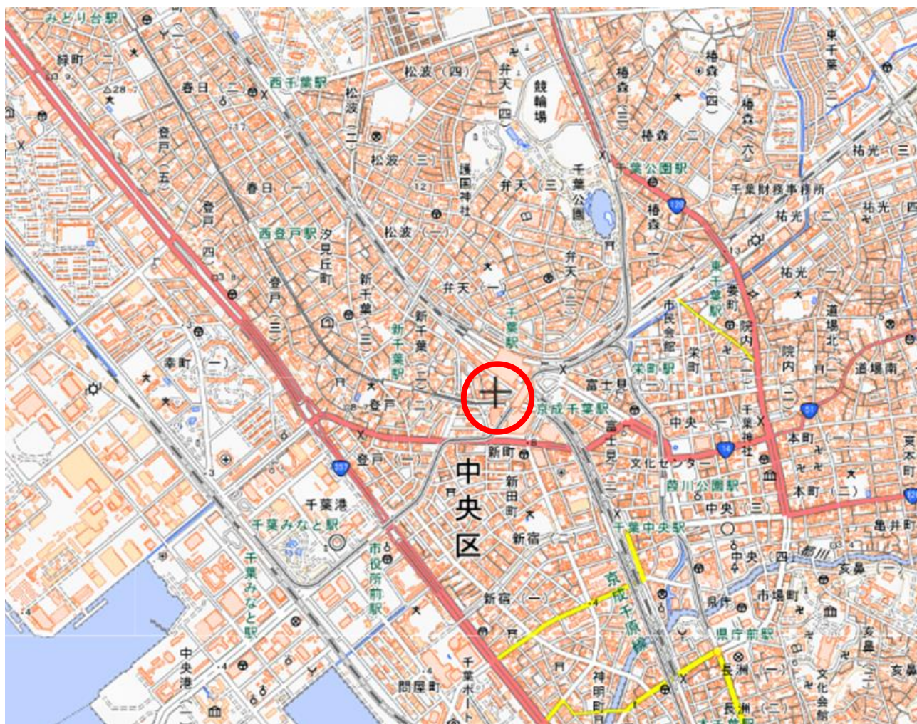
申請に関わる土地の周辺の地図