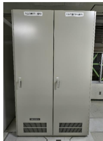
監視制御装置(平川浄水場外15施設)