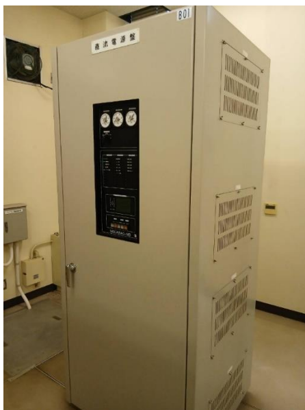
直流電源盤(大木戸浄水場)