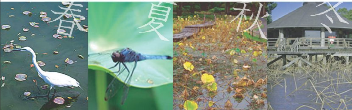
大賀ハス開花60周年記念