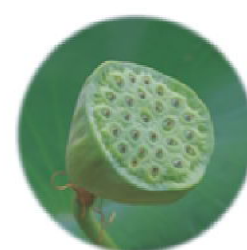
ハスの未熟な果托