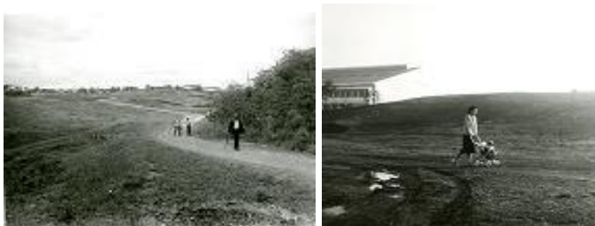
S29年頃(左)の競輪場付近/S32年頃(右)体育館付近

昭和34年に千葉市都市公園条例が施行されたことに伴い、千葉公園も都市公園として公告(オープン)しました。