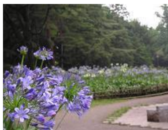
昭和37年頃の動物園/現在のアガパンサス花壇

現在のアガパンサス花壇あたりに、小動物園がありました。猿山や鳥小屋があったようで、身近に動物に触れられるスポットとして人気がありました。