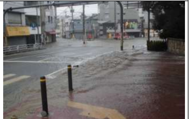
道路に流れ出した水