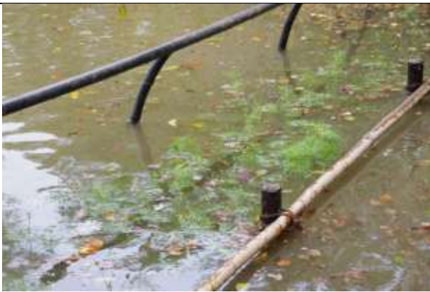
南門周辺から道路へ水が流れ出す