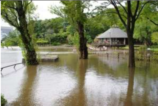
藤棚からハス池を望む