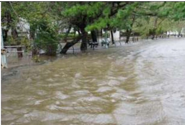
水門付近の波立つ池