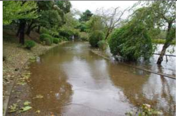
菖蒲園は水没し園路が冠水