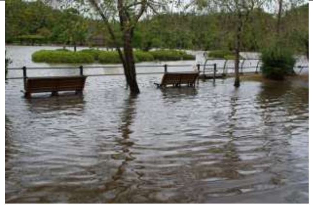
園路とベンチが冠水 (池の東畔)