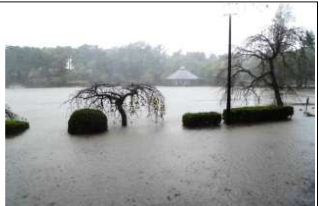
池岸の柵は完全に水没