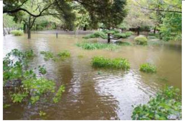
アジサイ園～菖蒲園