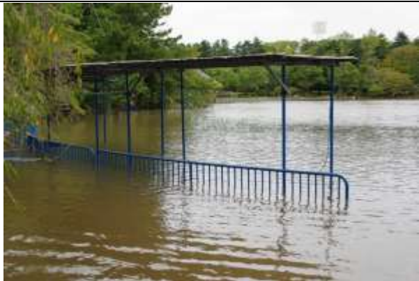
水没したボート乗り場