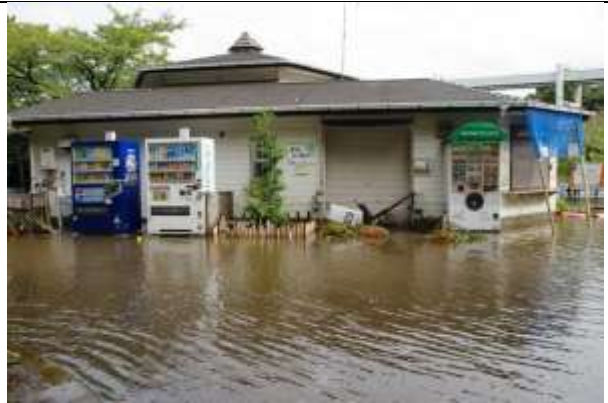
レストハウス正面