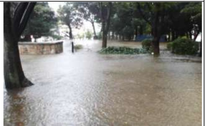
菖蒲園は水没し園路が冠水