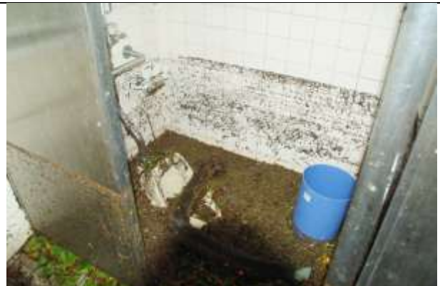
南門・男子トイレ