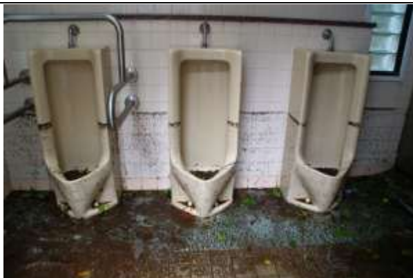
南門・男子トイレ