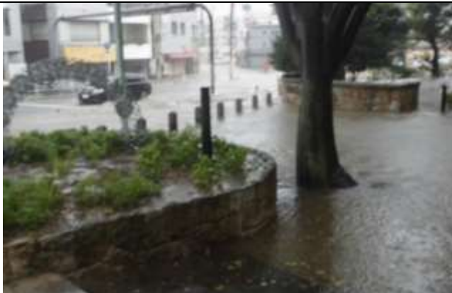
南門周辺から道路へ水が流れ出す