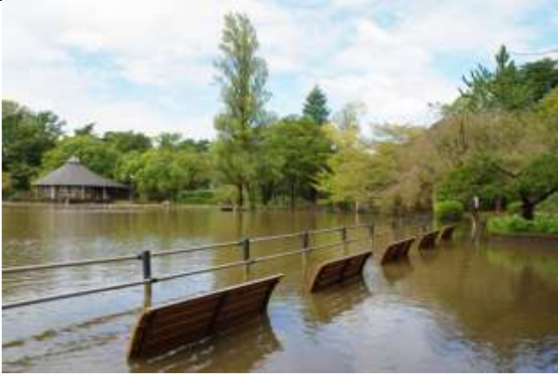
ベンチ座面まで冠水