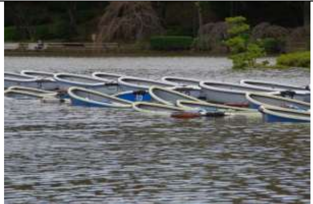
沈没しかかったボート