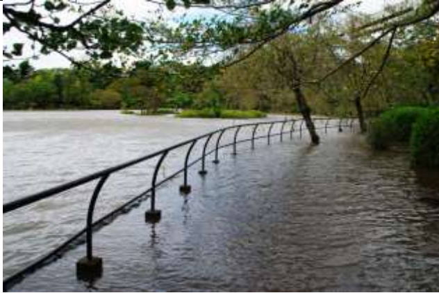
園路が冠水 (池の東畔)