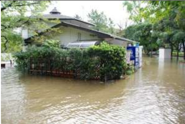
レストハウス北側