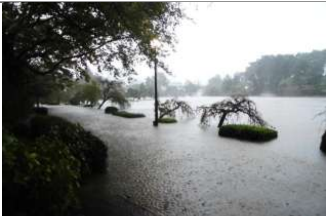
池が溢れ周囲の園路が冠水