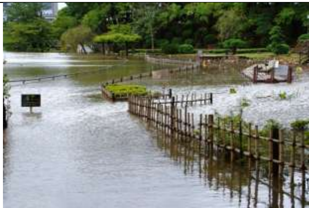
ハス池と池が一体になっている