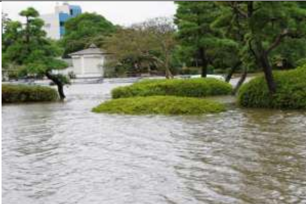
冠水した溢れた水が南門に押し寄せる