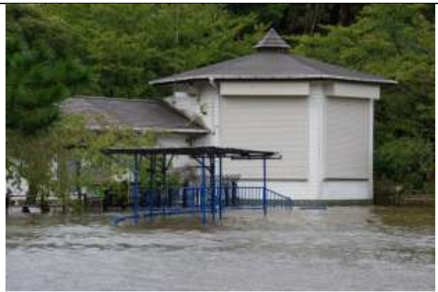
ボート・レストハウス東側