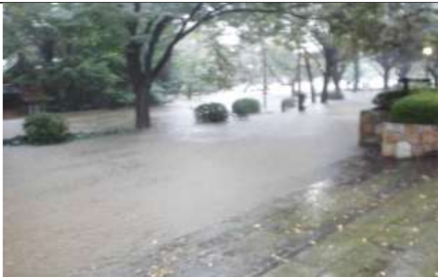
溢れた水が南門に押し寄せる