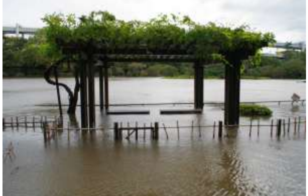
ハス池北側の藤棚