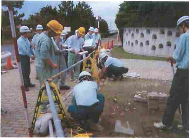
実地査定状況 稲毛海浜公園 花の美術館