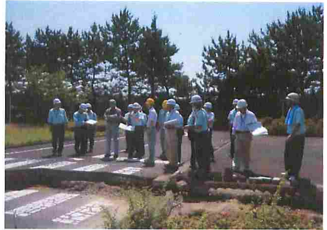
実地査定状況 花見川緑地