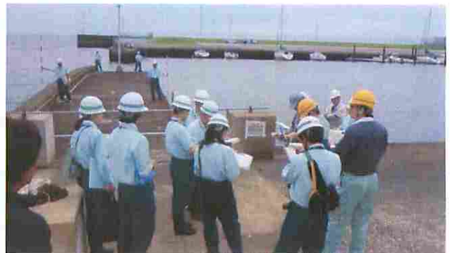
実地査定状況 稲毛海浜公園 ヨットハーバー