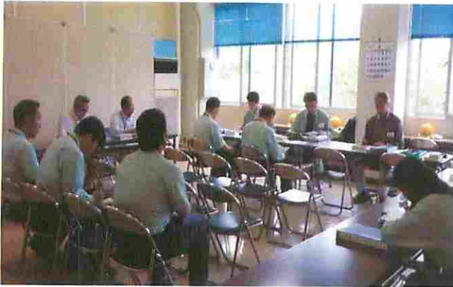
書類説明状況 美浜公園緑地事務所会議室