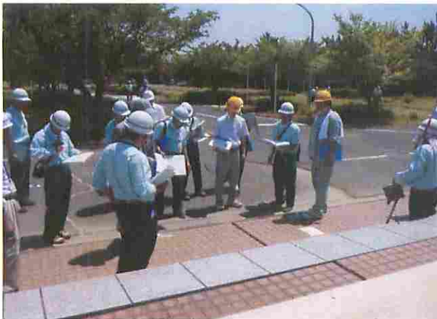
実地査定状況 花見川緑地