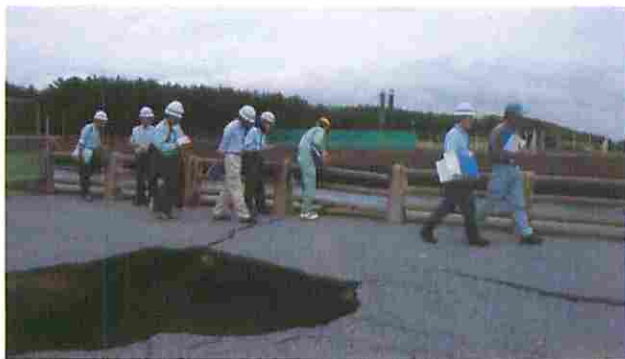
実地査定状況 稲毛海浜公園 ヨットハーバー