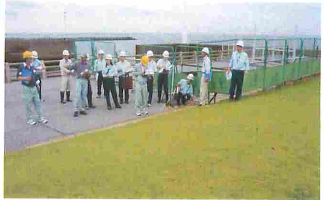
実地査定状況 稲毛海浜公園 ヨットハーバー