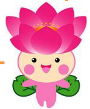
「花のあふれるまちづくりシンボル キャラクター」ちはなちゃん