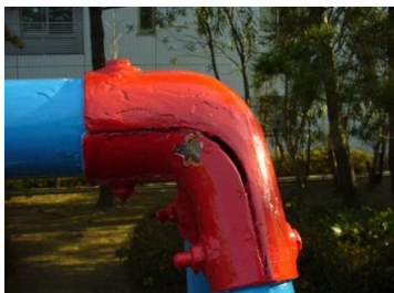
ぶらんこ本体部分の一部腐食