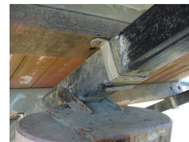
複合遊具の継手金具の腐食