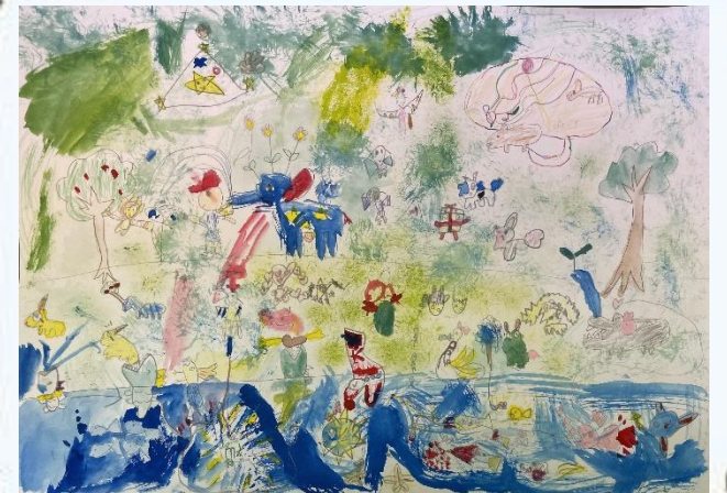
みどりとみずべとふしぎないきもの

まっこうジラに乗ってゆらゆら泳げたらなんてすてきでしょう。楽しい夢が広がります。