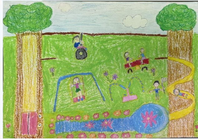
森のアスレチック公園