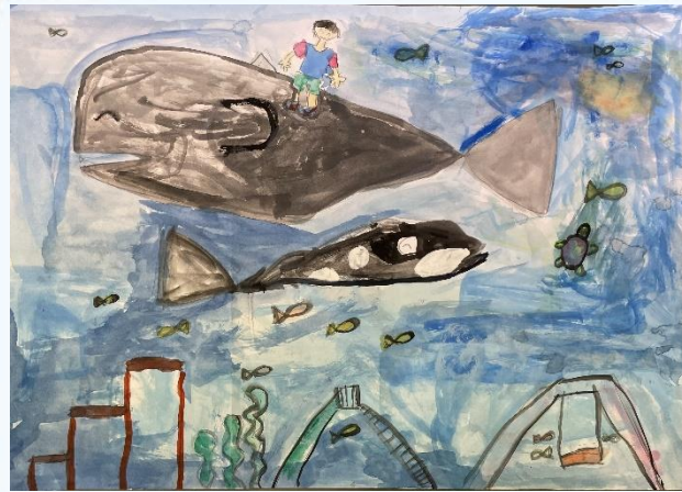
すいちゆうこうえん