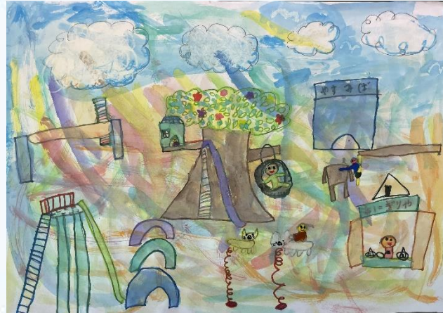
遊んでみたい公園

パスだけの混色で画面全体をみごとに描き上げています。遊んでいる友達の表情も楽しげにのびやかに描いています。