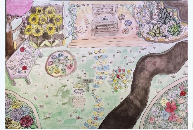
朝のカラフルな公園

夢の公園を画面いっぱいに楽しみながら描いています。淡い七色の絵の具を太筆で優しく吹く風のように描きさわやかな絵です。