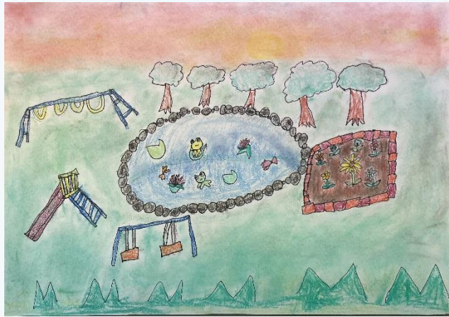
ゆうひのこうえん