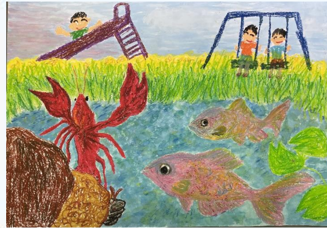
いきもののいる公園