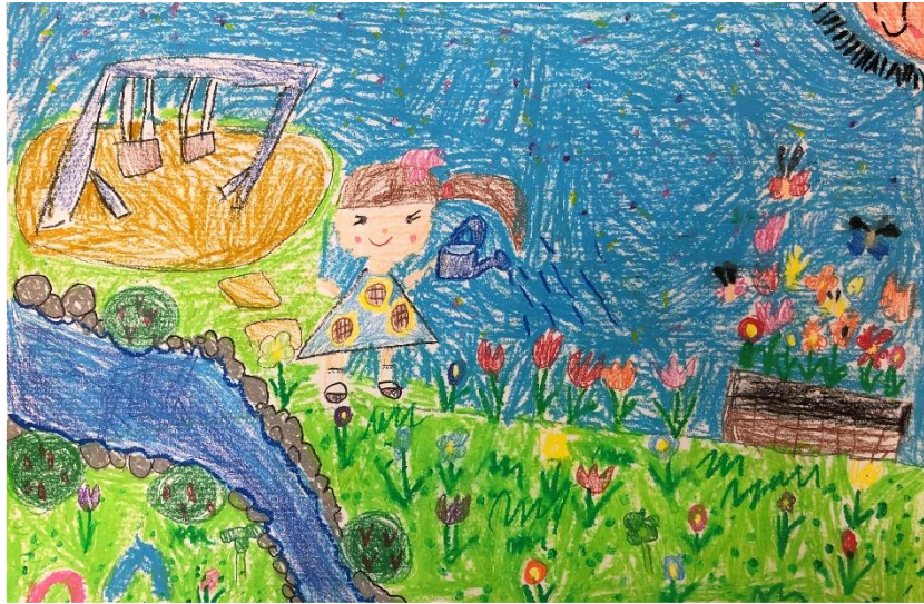
お花をいっぱい育てよう！！