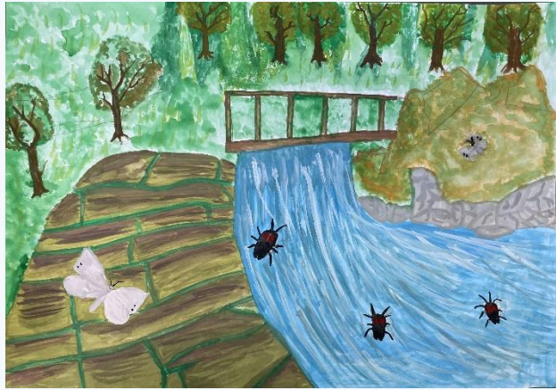
しぜんがいっぱい