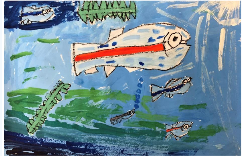
めだかのすいそう

山へのあこがれの気持ちを絵の具のビリジアンで力強く表現しています。森に生きる動物たちもていねいに描き入れ、青く流れる水が画面をひきしめています。