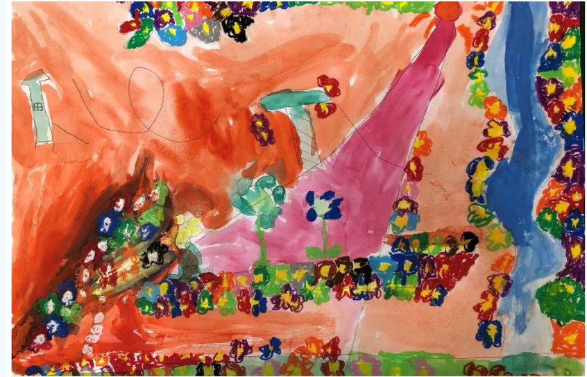
ゆうがたのおはなばたけ

紙いっぱいに明るい光があふれています。お花の一本一本もとても元気よく、見ていると嬉しくなってきます。