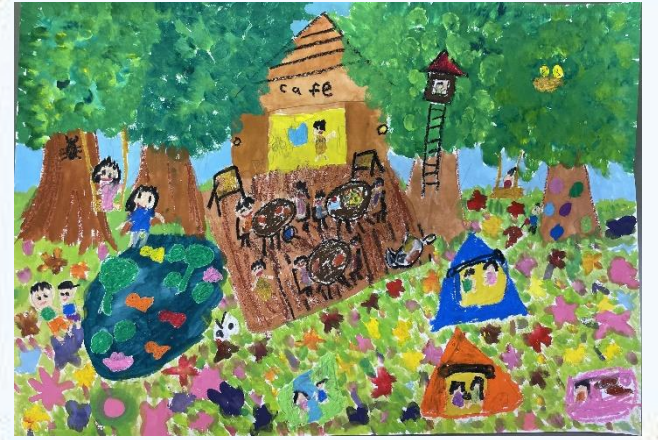
自ぜんいっぱいの公園

ハスの美しさが周辺の緑の中で描かれていますね。とても自然な色で濃淡を生かしハスの上品さが出ています。草の表現も緑が単調にならないように工夫されています。