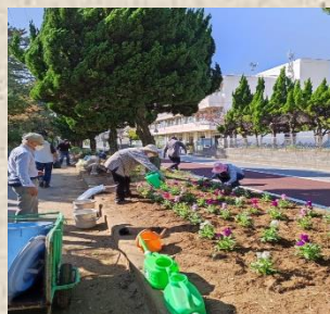
いそべ花づくりの会 (彩りガーデン大) 様