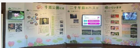
【蓮華亭展示リニューアル】 令和5年3月30日オープン