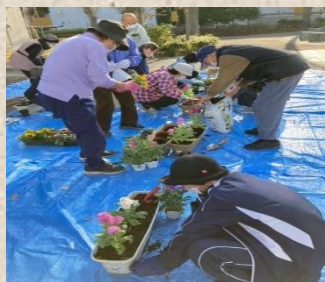
千草台花壇友好会 (にぎわい花壇) 様