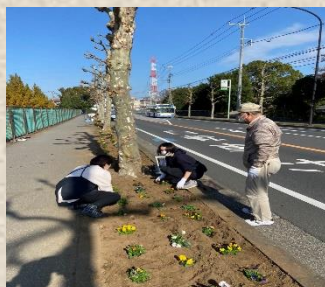
おゆみ野友好会 (彩りガーデン小) 様