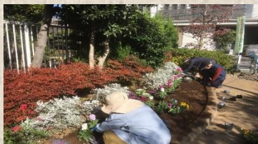
登戸3丁目自治会 (にぎわい花壇) 様