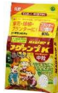
↑ 元肥 マグアンプ