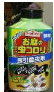
↑ 虫ケア用品(殺虫剤)