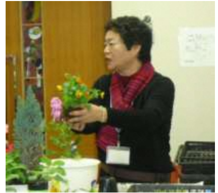
ビオラの植え付けの説明

土が均等に行き届いているかなど確認、全体調整、 不快害虫用誘引殺虫剤をまき 完了