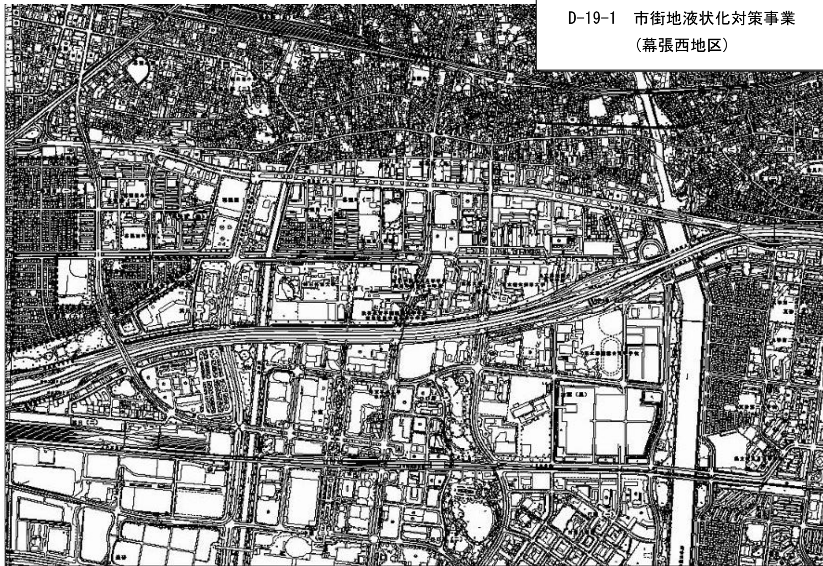
D-19-1 市街地液状化対策事業 (幕張西地区)