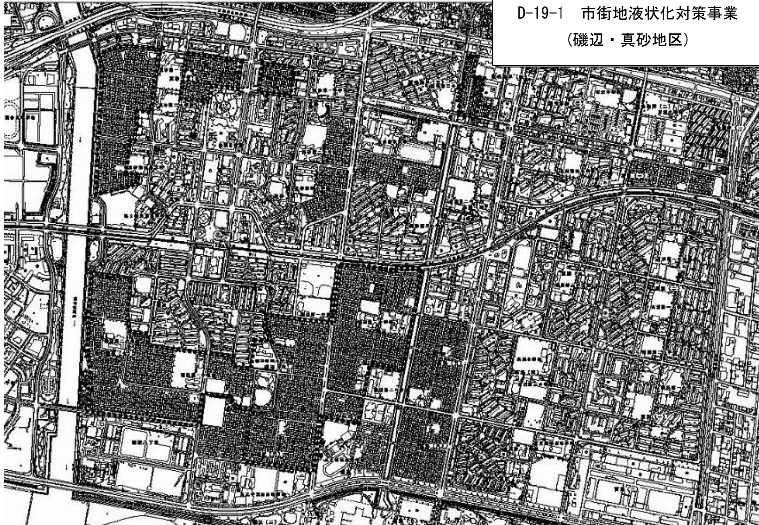
D-19-1 市街地液状化対策事業 (磯辺・真砂地区)