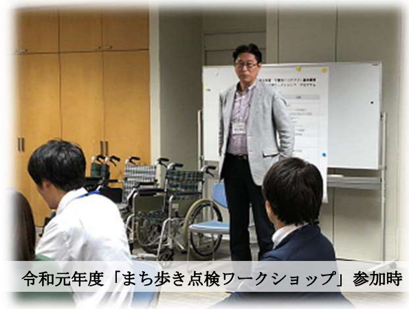
令和元年度「まち歩き点検ワークショップ」参加時

そのため、本計画を策定する過程において、持続可能なまちづくり、暮らしやすいまちづくりを目指し、バリアフリー化における優れた取組