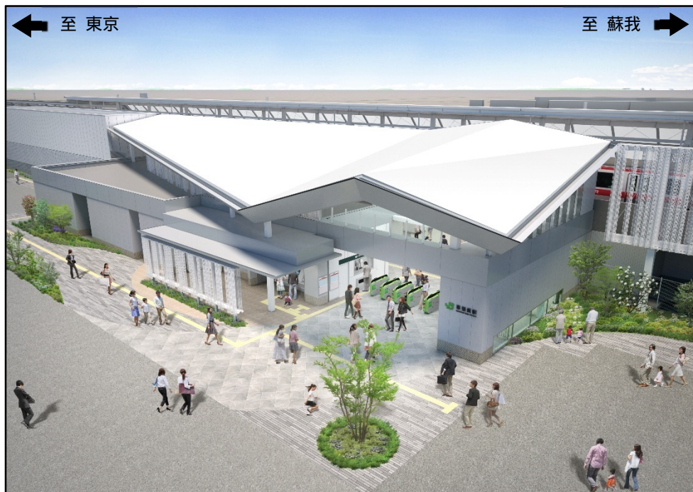
【駅舎外観イメージ図(南側より)】