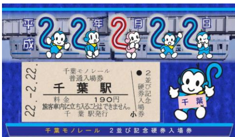
2並び記念硬券入場券

平成22年2月22日に「2並び記念硬券入場券」を4駅各222枚限定で、また、今年（2010年）10月10日に「10並び記念硬券入場券」を2010枚限定でそれぞれ発売した。