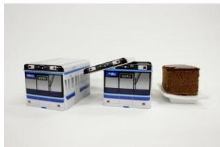
モノレールかすてら