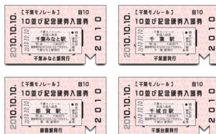
10並び記念硬券入場券