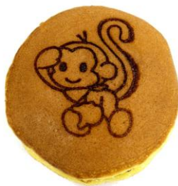
モノちゃんどら焼き