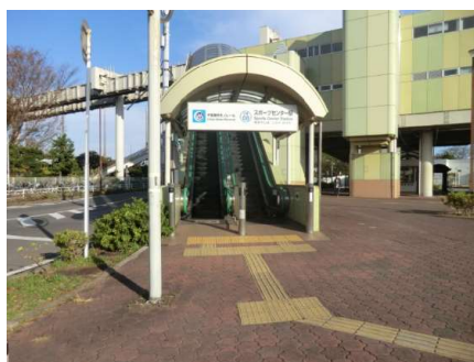
モノレールスポーツセンター駅