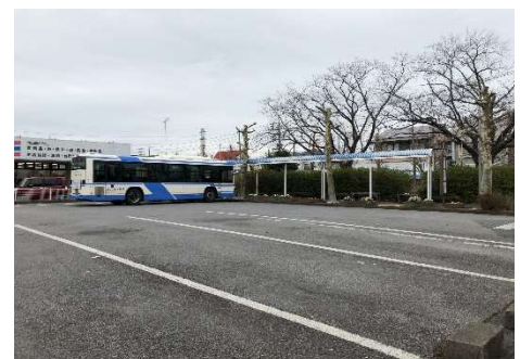
大宮団地バスターミナル