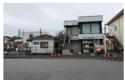
大宮台連絡所・千葉大宮郵便局