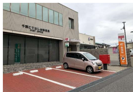
千葉こてはし台郵便局