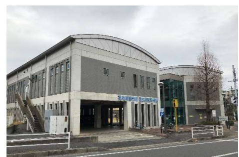
花見川図書館花見川団地分館 ・市民センター