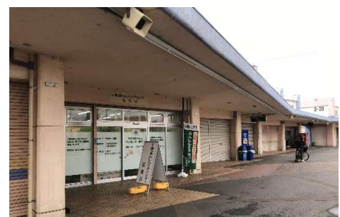
あんしんケアセンター花見川