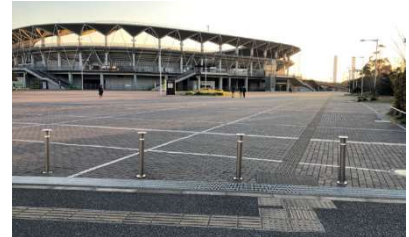
フクダ電子アリーナ (千葉市蘇我スポーツ公園内)