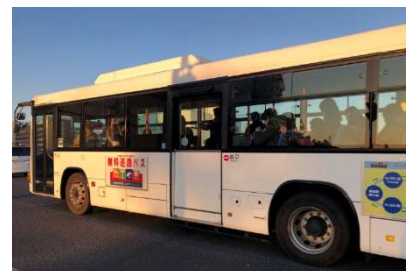
ハーバーシティ蘇我無料巡回バス