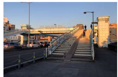
JR 蘇我駅西口歩道橋