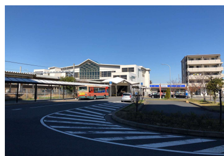
JR 浜野駅東口駅前広場