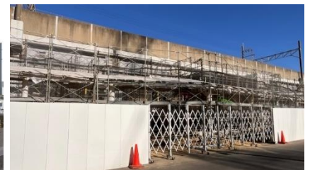
南口外観写真（2024年12月現在）