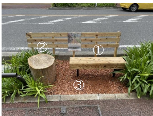
設置したベンチ等