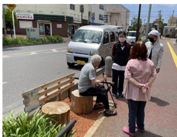
ベンチ等の利用の様子