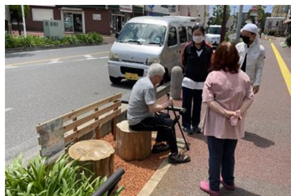
みちばた空間の利用の様子