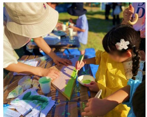
色塗りワークショップの様子