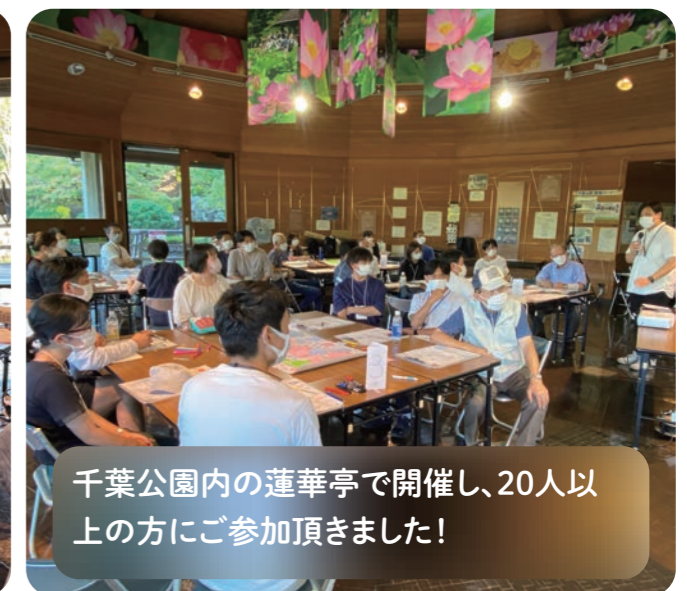
千葉公園内の蓮華亭で開催し、20人以上の方にご参加頂きました!

第1回ワークショップ 10/29(土) 千葉公園内 12:50~15:30 @ 蓮華亭