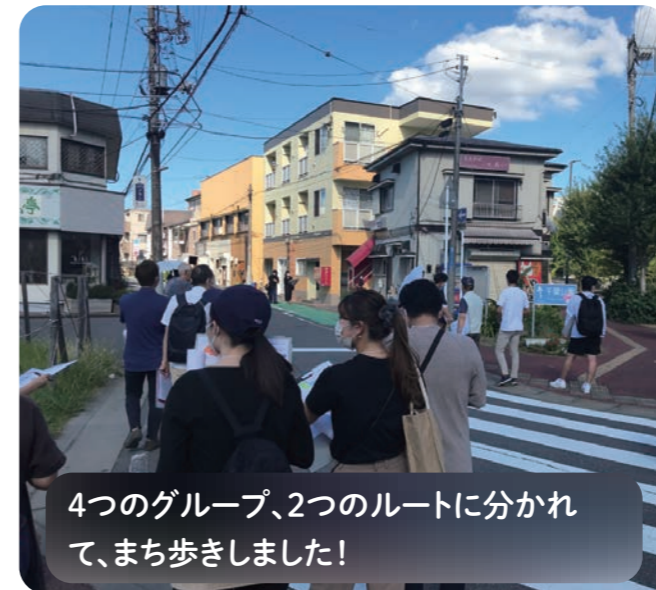
4つのグループ、2つのルートに分かれて、まち歩きしました!