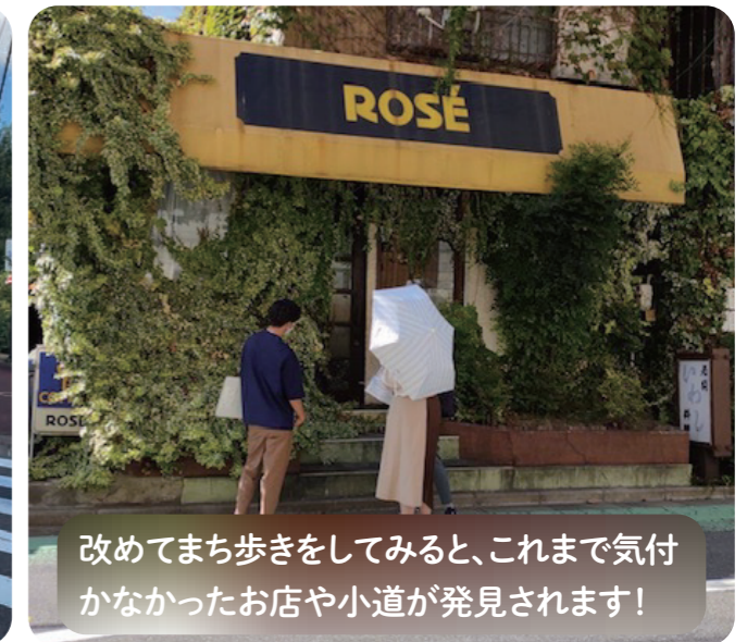
改めてまち歩きをしてみると、これまで気付かなかったお店や小道が発見されます!