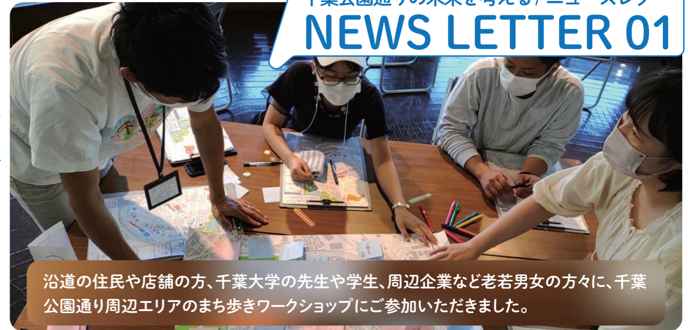
沿道の住民や店舗の方、千葉大学の先生や学生、周辺企業など老若男女の方々に、千葉公園通り周辺エリアのまち歩きワークショップにご参加いただきました。