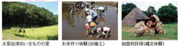
大草谷津田いきもの里 お米作り体験(田植え) 加曾利貝塚(縄文体験)

大草谷津田いきもの里の自然観察会や、子どもたちの森公園、火おこしや土器づくりを行う加曾利貝塚博物館の縄文体験など自然と身近にふれあえる環境が整っています。