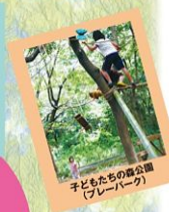
子どもたちの森公園(プレーパーク)

若葉区には15万人の人が住んでいて、広さは千葉市の中で、一番なんだ。大きな公園で遊んだり、市民農園・観光農園でいろいろな体験ができて楽しいよ。自然の中でのびのび暮らせる区なんだ。