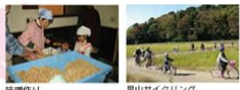
味噌作り 里山サイクリング

「わたしの田舎」 谷当(やとう)工房(谷当町) そば打ち・ソーセージ・ハム・味噌等の手作り体験や、パーベキュー・山菜摘み・筍掘り・炭焼き・田植え体験もできます。