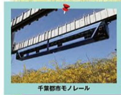
千葉都市モノレール