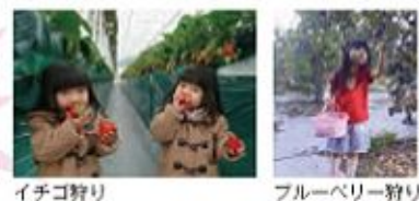
イチゴ狩り ブルーベリー狩り

ドラゴンファーム(小倉町) 冬〜春はイチゴ狩り、夏はブルーベリー！ 栽培しているイチゴは14品種、食べ比べを楽しめます。 千葉中央観光農園(小倉町) 夏から秋にかけて、ブドウ狩りやナシ狩り、クリ拾いなどが楽しめます。