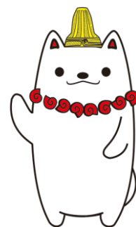
加曾利貝塚PR大使 かそりーぬ

すべての入賞者の方に 若葉区ならではの地元 銘菓、地元野菜詰め合 わせなどの記念品を ご用意しています!