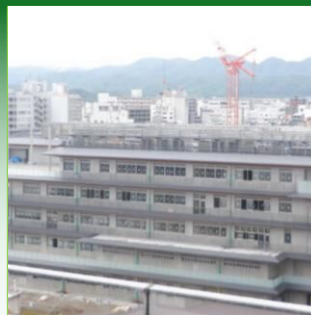
グリーンビルディングに関する事業