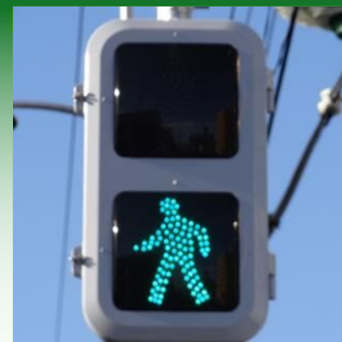
省エネルギーに関する事業