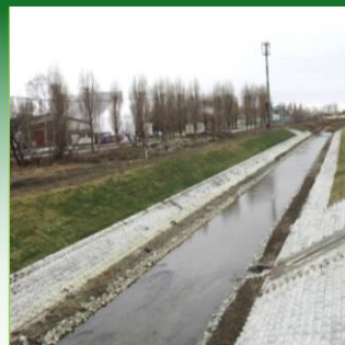
気候変動に対する適応に関する事業