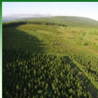
森林資源の保全・管理に関する事業