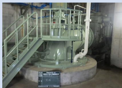
ポンプ場整備事業