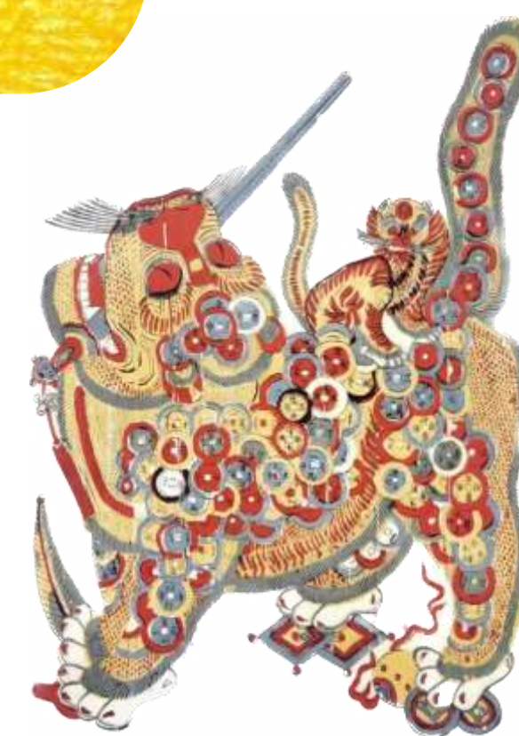
年画(正月を祝う民間絵画)に描かれた虎

中国の古典には「苛政は虎よりも猛し」(苛酷な政治は虎よりも恐ろしい。だから、たとえ恐ろしい虎が出るとしても、政治の及ばない山中に暮らすのである。)という故事成語があります。古代から中世においては、中国大陸の山間部に生息する虎は、人にとって大きな脅威でした。しかし16世紀ごろには、山間部開発の進展とともに虎は次第に姿を消していきます。にもかかわらず、虎の記憶は近世から近代においても残り続け、伝承の中の虎は「正義」を執行する神に近い存在になっていきました。