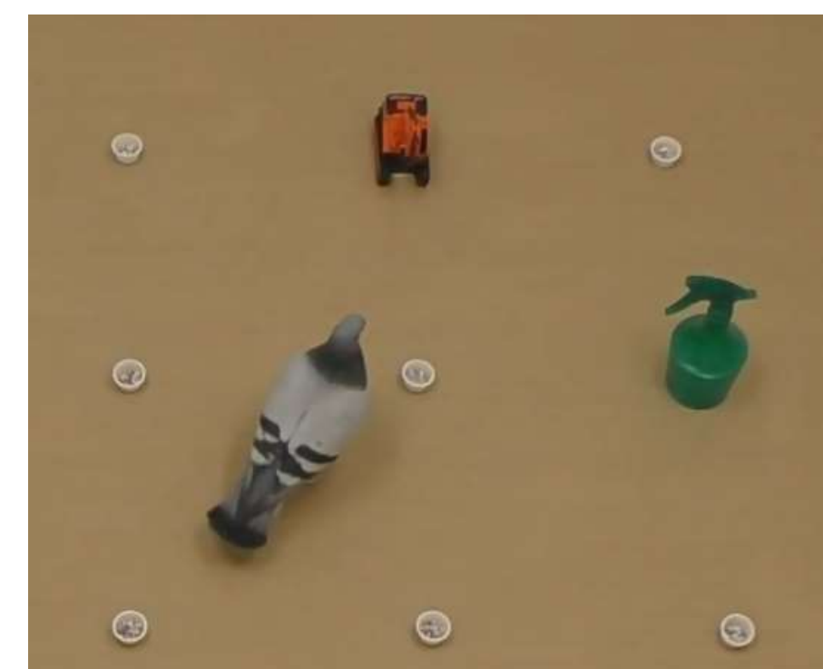
ハトの実験の様子

動物たちはヒトより下等な生き物とみなされ、単純な本能に従って生きていると信じる人も多い。この講演では、動物の帰巢に焦点を当て、時として人間より優れた彼らの空間認識について紹介する。また、どうやってそれを調べたか、その科学的方法も解説する。さらに、千葉市動物公園との共同研究を紹介しつつ、動物たちが豊かな心の世界に生きていることを示す研究について見ていく。