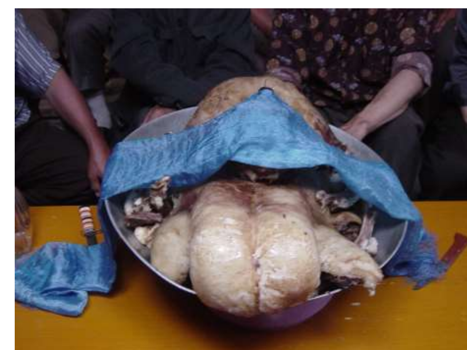
モンゴルの儀礼料理 ヒツジの丸煮「シュース」

モンゴルの代表的な食は「白い食べもの」の乳製品と「赤い食べもの」の肉です。モンゴル牧畜民は自分たちが飼っている家畜をどのように食するのか。今回の講演では、主にヒツジ肉の利用からモンゴルの自然と文化を紹介します。