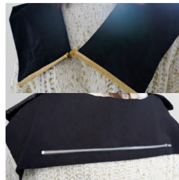
色の知識から デザイン発想