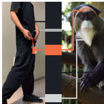
動物 ファッション診断