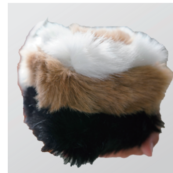
表面を再現した オブジェクト